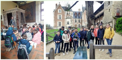
Visite guidée au château d'Amboise et du Clos-Lucé

En avril, les CE1/CE2 et les CE2/CM1 sont partis en classe de découverte dans les châteaux de la Loire. Les enfants ont beaucoup apprécié cette parenthèse culturelle. Un grand merci à la Municipalité pour le financement d'un tiers du projet. Merci aussi aux parents qui se sont investis dans ce projet.