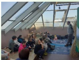
A la maison de l'estuaire

La Mairie propose chaque mois de nouvelles expositions que les classes peuvent visiter et les artistes, souvent, se proposent pour un échange avec les enfants autour de leur travail artistique. Nous les remercions pour leur accueil et ce moment de partage.