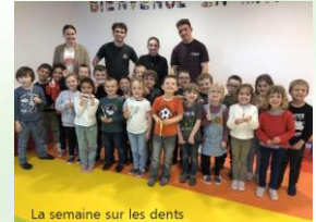
La semaine sur les dents

Cet hiver, l'école a reçu des stagiaires d'écoles médicales pour sensibiliser les élèves au bon usage des écrans puis pour travailler sur l'hygiène bucco-dentaire .