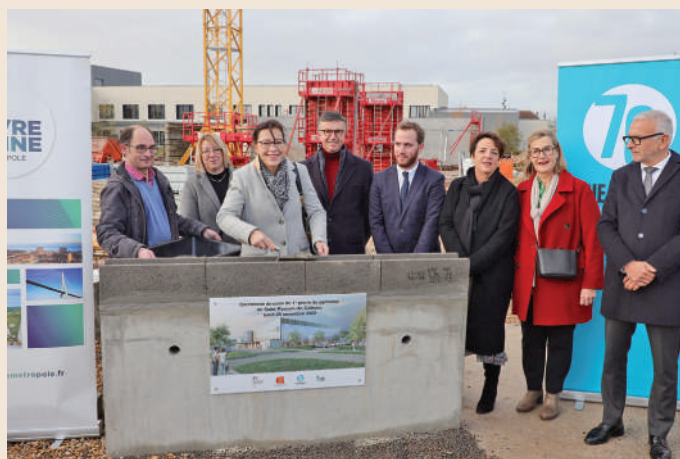
Pose de la première pierre du gymnase communautaire de Saint-Romain-de-Colbosc le 28 novembre dernier

La nouvelle structure permettra la pratique du basket-ball, du handball, du volley-ball, du badminton et possédera également un mur d'escalade. La future construction proposera une architecture sobre qui s'intégrera harmonieusement aux sites alentours, avec comme matériaux la brique de terre cuite blanche, le zinc et le bois. La façade nord de la salle d'évolution conservée bénéficiera de travaux de rafraîchissement dans le cadre du présent projet. Les travaux devraient s'achever en août 2023.