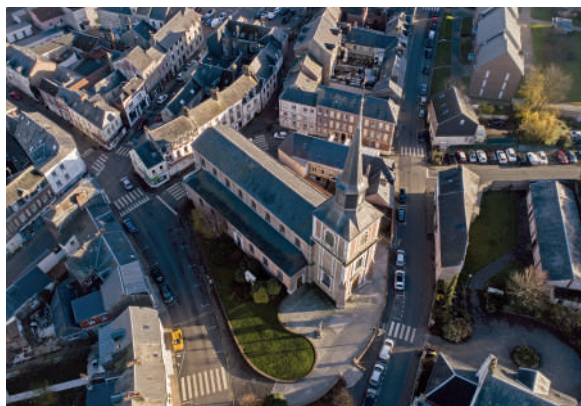
Vue aérienne de Saint-Romain-de-Colbosc

L'Opération Programmée d'Amélioration de l'Habitat – Renouvellement Urbain (OPAH-RU), menée sur ces trois communes, s'inscrit dans le dispositif Petites Villes de