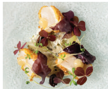
Saint-Jacques panées, condiment algues et combawa, olives de Kalamata, dulce, citron confit