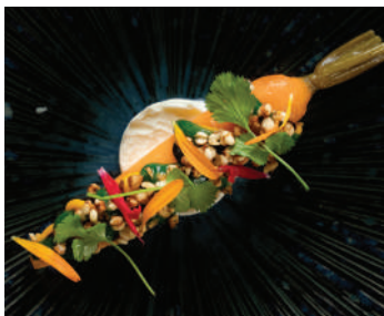
Carotte confite de M. Aubin, cumin, coriandre, ail noir, labné, sésame, fond brun de légumes